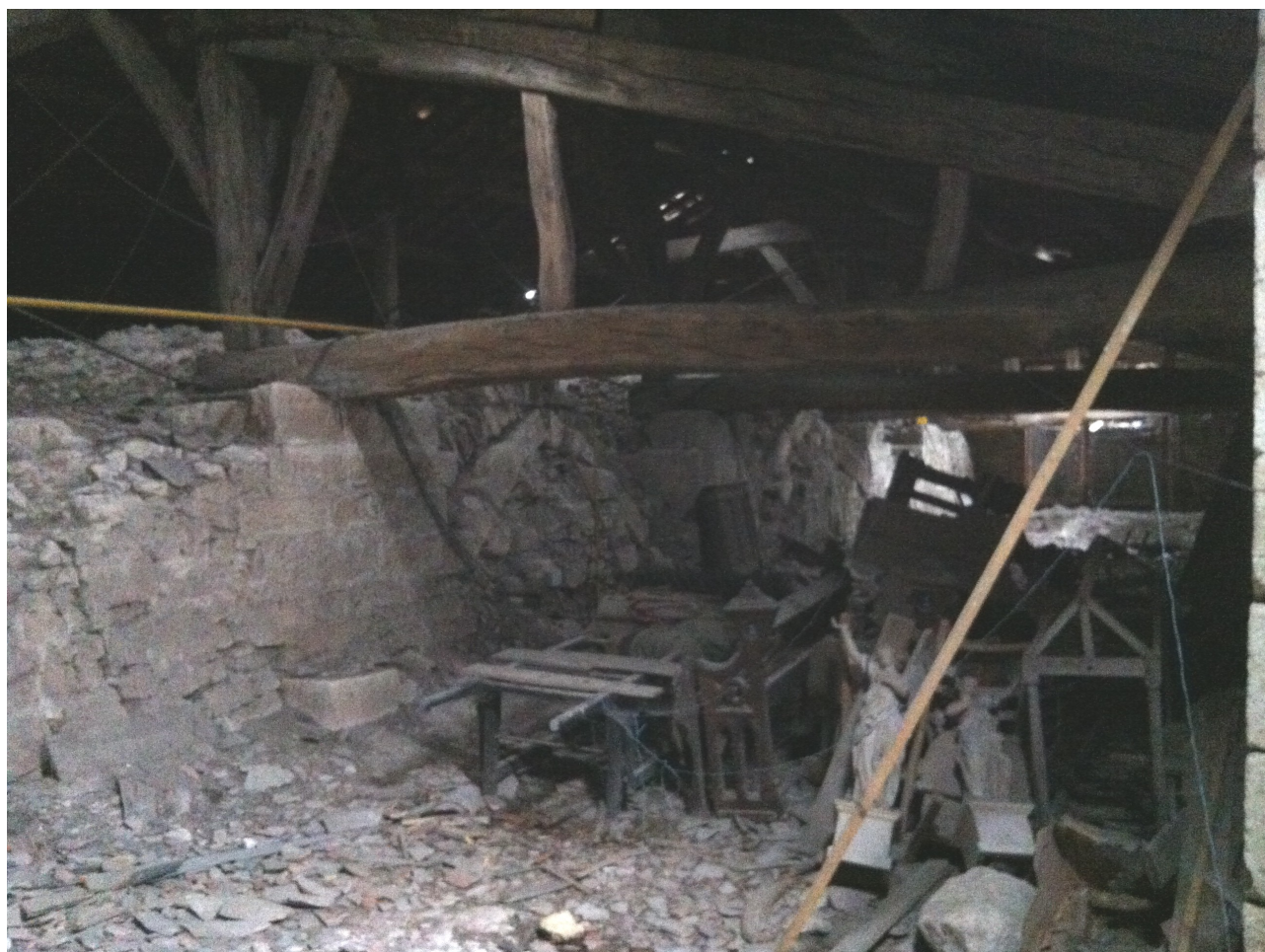
La salle de refuge

Les organes de défense active : la tourelle d'escalier est percée d'une archère et de 4 ouvertures de tir rectangulaires . Les combles de l'abside et des chapelles latérales orientales sont défendues par 4 fenêtres de tir. Les murs de surélévation N-E/S-E des bras du transept sont chacun munis d'une ouverture rectangulaire. Une fenêtre avec barre d'appui et corbeaux pour mantelet surmonte la chapelle nord-ouest du transept. La partie supérieure du mur pignon et l'exhaussement des collatéraux comportent 6 fenêtres de tir au total.